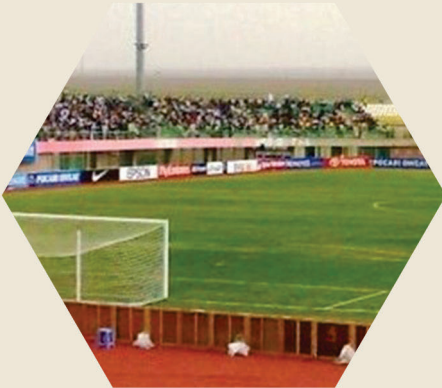
ملعب يادگار إمام (قدس سره)