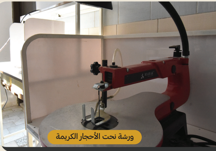
ورشة نحت الأحجار الكريمة