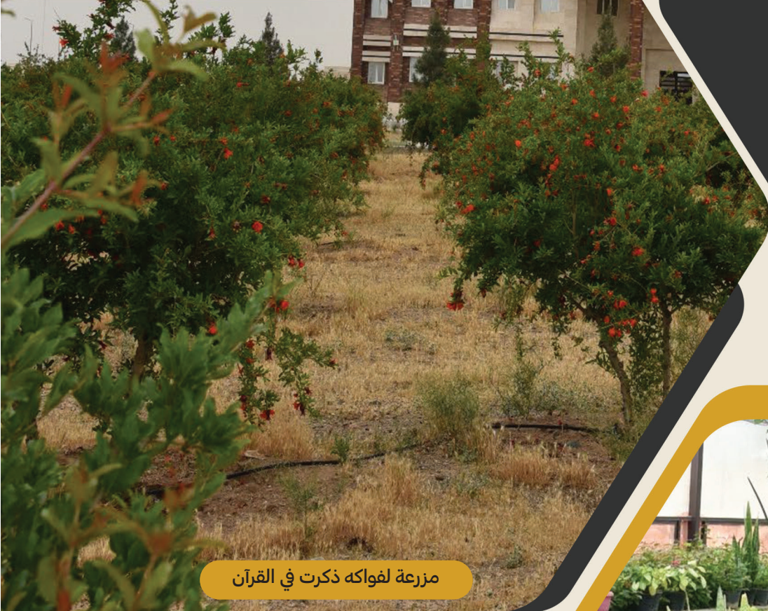
مزرعة لفواكه ذكرت في القرآن