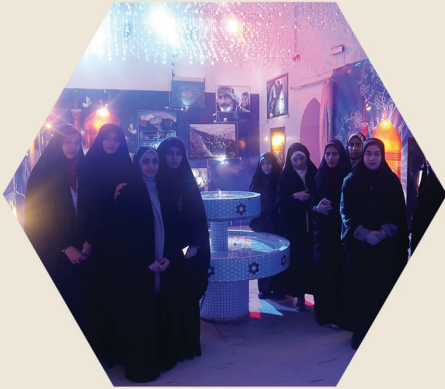
سفرة مشهد للسياحة و الزيارة