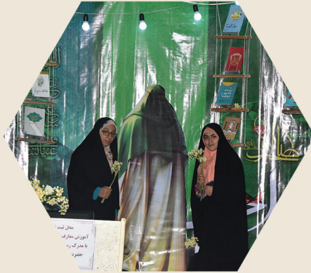
احتفال لصاحب الزمان (ع)