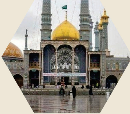
المرقد المقدس للسيدة العصومة