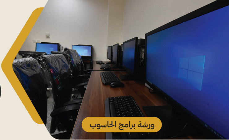
ورشة برامج الحاسوب