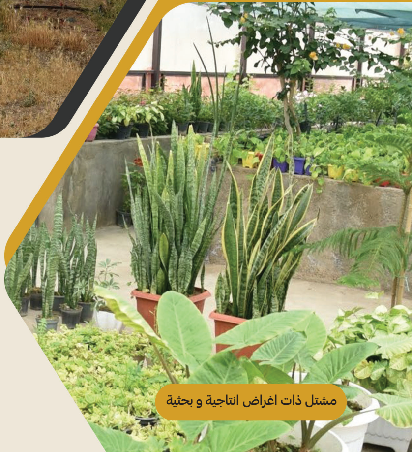
مشتل ذات اغراض انتاجية و بحثية