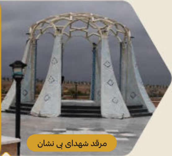
مرقد شهدای بی نشان