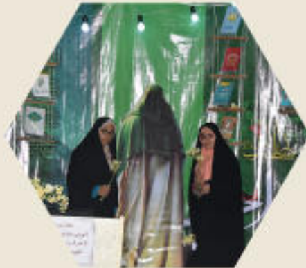
جشن میلاد صاحب الزمان (ع)