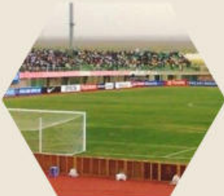
ورزشگاه یادگار امام (قدس سره)