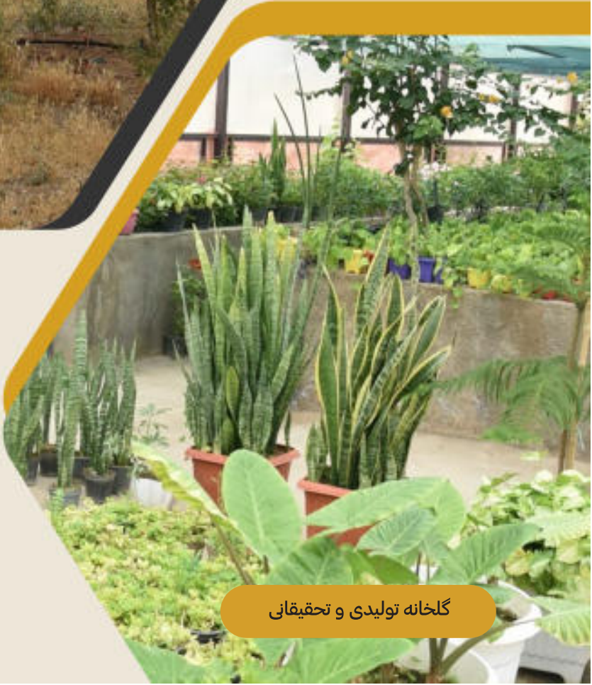
گلخانه تولیدی و تحقیقاتی