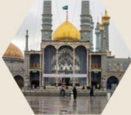
مرقد مقدس حضرت العصومه(س)