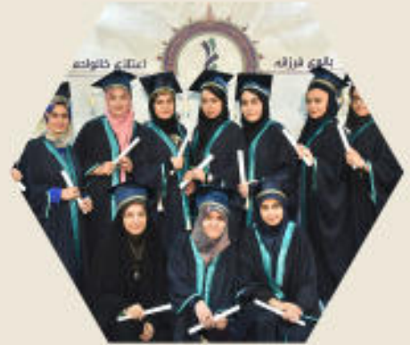
جشن دانش آموختگی