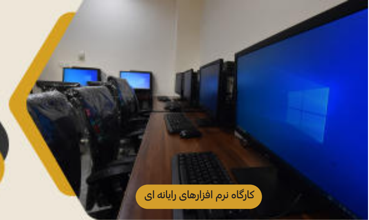
کارگاه نرم افزارهای رایانه ای