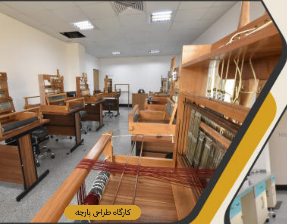
کارگاه طراحی پارچه