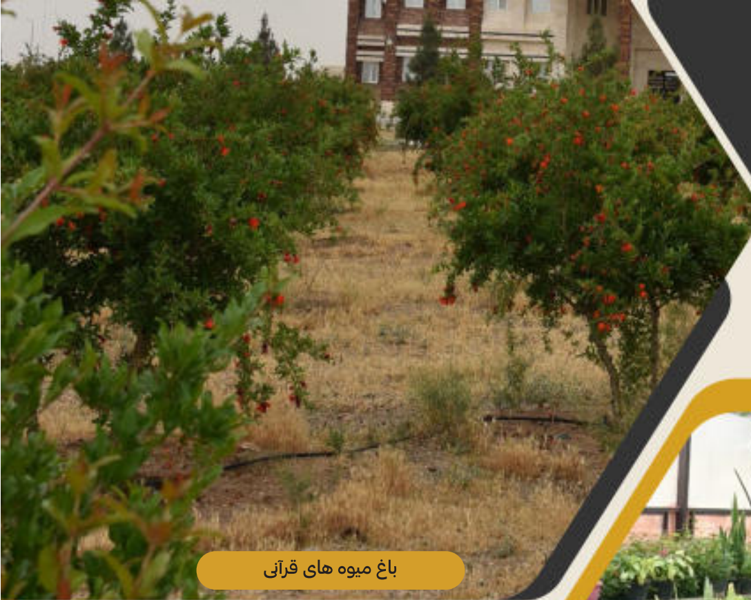
باغ میوه های قرآنی