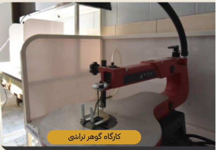
کارگاه گوهر تراشی