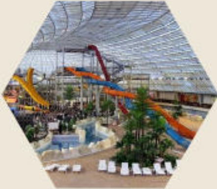
پارک آب و تاب