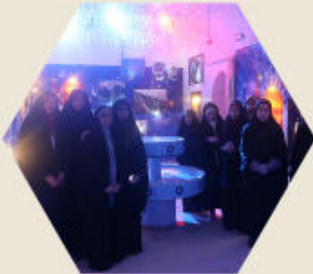
اردوی زیارتی به مشهد مقدس